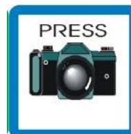
NOVINAR - FOTOGRAF